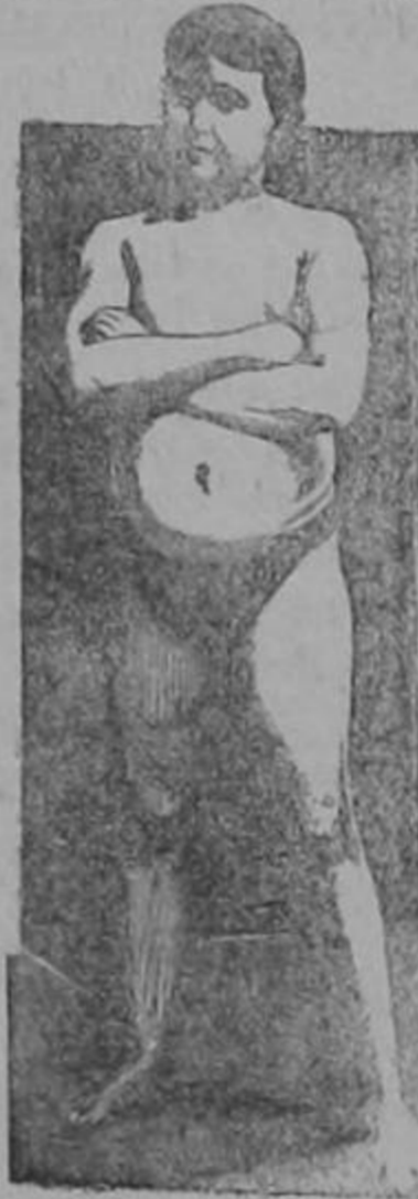
EDAD 11 AÑOS

La transformación maravillosa de un sér endeble y raquítico en un adolescente fuerte, robusto y sano, como lo demuestra su atlética figura, fué obra realizada por la